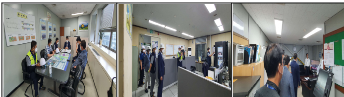
FTZ 폭염, 풍수해대비 브리핑

8월에는 경영진의 현장점검 및 휴게시설에 대한 현황 조사·특별조사가 이루어졌습니다. 9월에는 외부전문가의 휴게시설 특별점검과(~9.30.) 3분기 합동 안전점검(9.5.)이 이루어집니다. 안전한 근무지 조성을 위해 항상 노력하겠습니다!