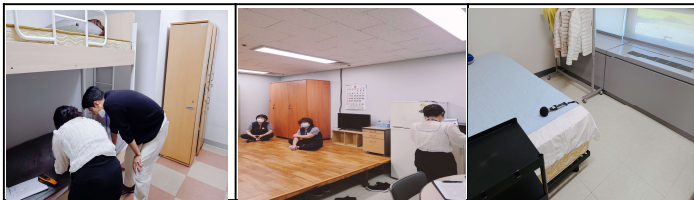
안전보건팀 휴게시설 점검