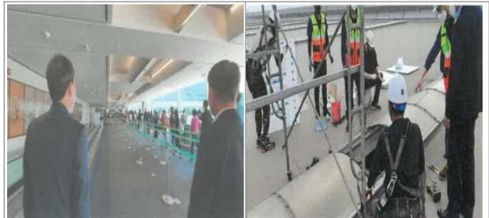
T1여객터미널 입국승객 방역 절차 점검