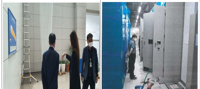
T2귀빈실, 환경미화 누수지역 및 보수