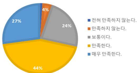
소식지 내용이 유익하다고 생각하십니까?