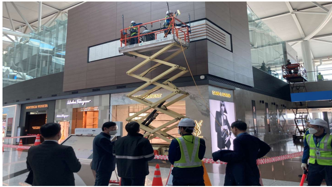
▲ 2022.2.22. 환경미화 업무현장 방문