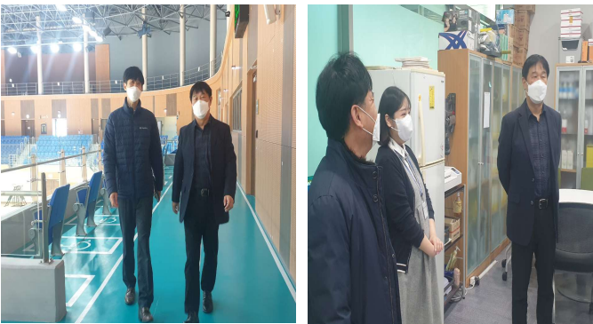
▲ 2022.2.24. 사업2본부 업무현장 방문