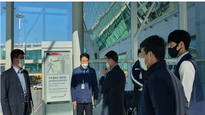
▲ 2022.2.8. 탑승교 업무현장 방문

2월 한달 동안 우리 회사 경영진들이 각 작업 현장을 방문하셨습니다. 사장님을 비롯하여 경영본부장님과 각 사업본부장님들께서는 현장을 직접 방문하시어 사고발생 위험지역과 근로자 휴게실 등을 확인하고 근로자의 의견을 청취하는 시간을 가졌습니다. 우리 회사 모든 근로자들의 노고에 감사드립니다.